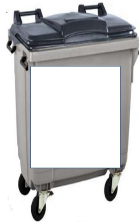
une poubelle en 2015

Imprimez les pages suivantes et complétez-les.