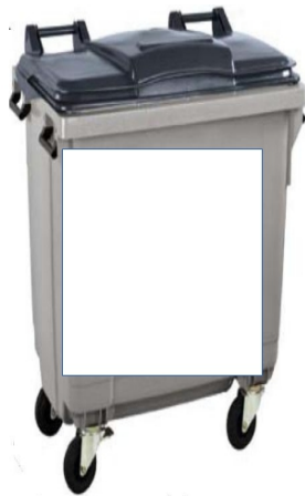
une poubelle en 1960

Etudiez l'évolution du contenu des poubelles.